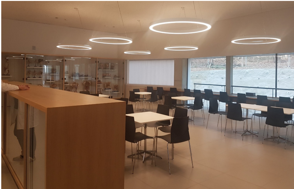
Raum für die Vorträge, Studierzone Nord, 1. Stock

Neben dem Einfahrtsschranken ist LINKS die Einfahrt in die Tiefgarage. Bitte diese benützen !!