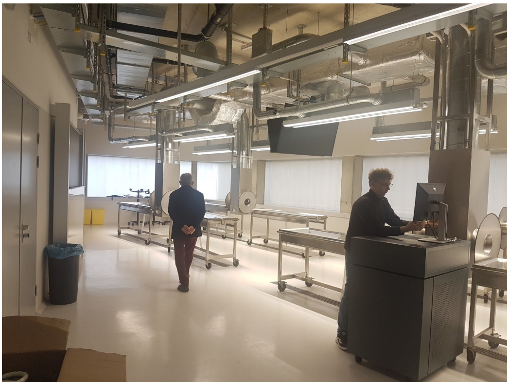
Sezierraum postgraduelles Training, Studierzone Nord, 1. Stock

Pro Seziertisch 4 Teilnehmer. Jeder Teilnehmer hat eine Gesichtshälfte zur Verfügung !