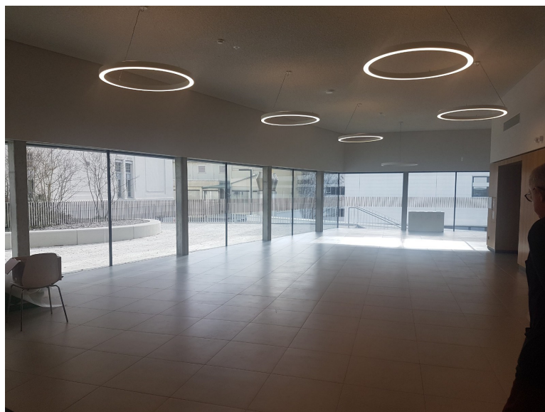
Raum für Aussteller und Catering, Studierzone Nord, 1. Stock