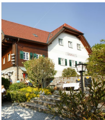
Hotel u. Gasthaus Stoffbauer

( Fahrzeit mit dem Auto zum Anatomischen Institut ca. 10 min)